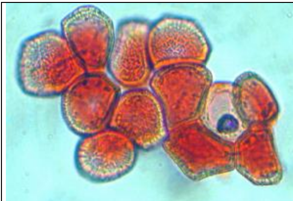
Uredospores colorées au Rouge Congo SDS