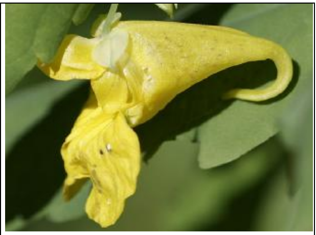
Impatiens noli-tangere L. : plant et détail de la fleur (photos trouvées sur le Net)